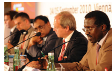
Coprésidents du PAEE lors de la 5 e réunion du Groupe conjoint d'experts, le 15 septembre 2010, à Vienne.