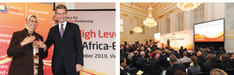
Elham M.A. Ibrahim, Commissaire aux infrastructures et à l'énergie de l'Union africaine et Günther Oettinger, Commissaire européen pour l'Énergie à la Conférence de haut niveau, du PAEE, le 14 septembre 2010.

L'EUEI PDF gèrera, coordonnera et assurera le suivi des activités dans la phase de démarrage du RECP en vue de développer ce dernier en un programme décennal.